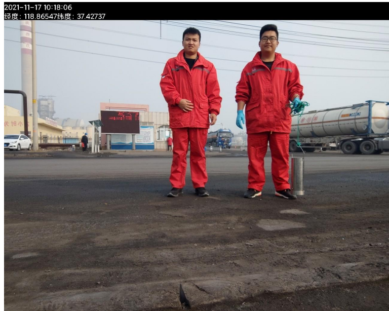
图 1 检测前合影